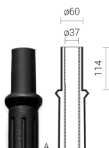
Тип zakończenia „A” – Ø60

Układy ramion: typu "P", Wysięgniki do montażu na słupie: WT, WA-1, WA-01, WA-4