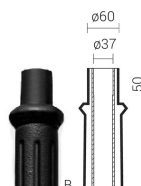
Тип zakończenia „B” – Ø60

Układy ramion: typu "P", Wysięgniki do montażu na słupie: WT, WA-1, WA-01, WA-4